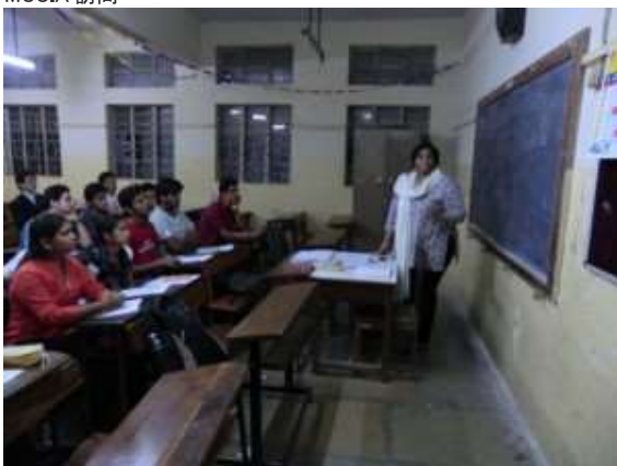
ブネ大学日本語授業風景